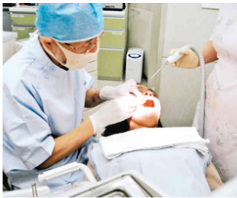
非外科的骨再生療法で歯の汚れ除去を受ける患者＝東京都新宿区のカダデンタルクリニックで

歯を支える骨などが炎症を起こして溶ける歯周病。国民の約七割がかかり、歯を抜く原因の四割以上がこの病気だ。治療や予防に心がけ、いつまでも自分の歯でおいしく食事を楽しみたい。十一月八日は「いい歯の日」。最新の治療法取材した。（鈴木久美子）